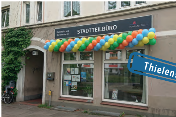
Besuchen Sie uns im Stadtteilbüro in der Thielenstraße

Im Stadtteilbüro in der Thielenstraße können Sie sich über die Entwicklungen im Korallus- und Bahnhofsviertel informieren. Und Sie können mitmachen. Haben Sie Ideen und Wünsche für Ihr Quartier oder möchten