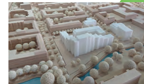
Modell vom Bahnhofs- und Korallusviertel

Haben Sie eine Idee für ein Projekt für die Nachbarschaft und möchten dafür Geld beantragen? Dann kommen Sie im Stadtteilbüro vorbei. Wir unterstützen und beraten Sie.