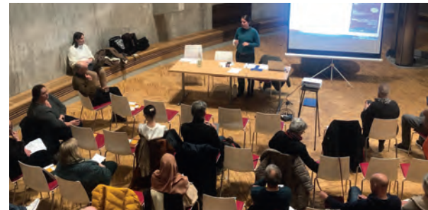
Der Quartiersbeirat bei der Arbeit

Wenn Sie die Veränderungen in Ihrem Quartier begleiten und mitgestalten möchten, engagieren Sie sich im Quartiersbeirat. Im Quartiersbeirat geht es um aktuelle Themen aus dem Bahnhofs- und Korallusviertel. Der Quartiersbeirat trifft sich ungefähr 5-mal im Jahr und die Treffen dauern etwa 2,5 Stunden.